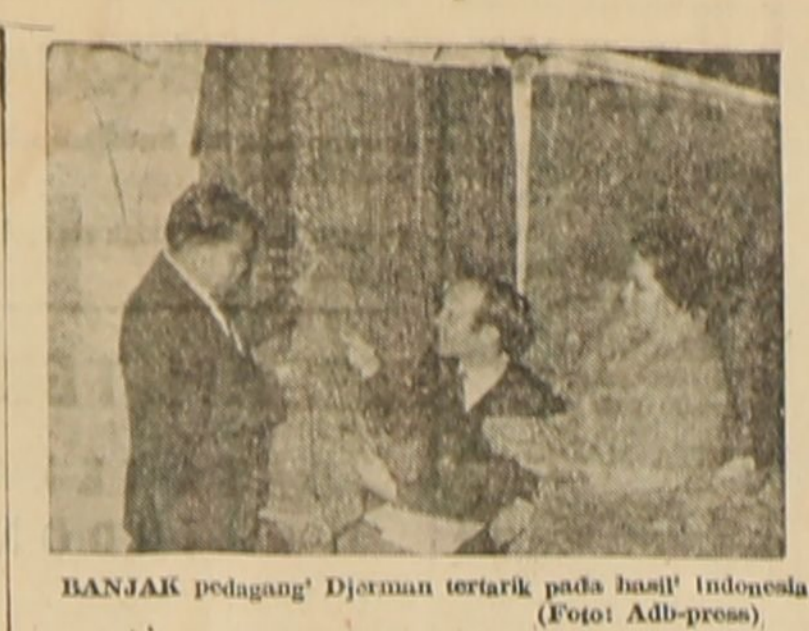
BANJAK pedagang Djerman tertarik pada hasil Indonesia.

Djakarta, (IPMI) Di antara petugas Polisi Lalu Lintas yang terkenal di Jakarta adalah mereka yang bertugas di jembatan Antjol dan tanda larangan. Mereka bertugas menjaga keamanan dan ketertiban di jembatan Antjol dan tanda larangan.