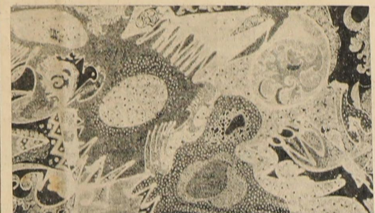
DETAIL, variasi 60, sebuah lukisan batik terdahulu karya sangkar batik 'Giri Kentjana' Jogjakarta...

Mengetahui pasal 34 RUU, tenag siparat parpol yang boleh (BERSAMB KE HAL III Kol 7)