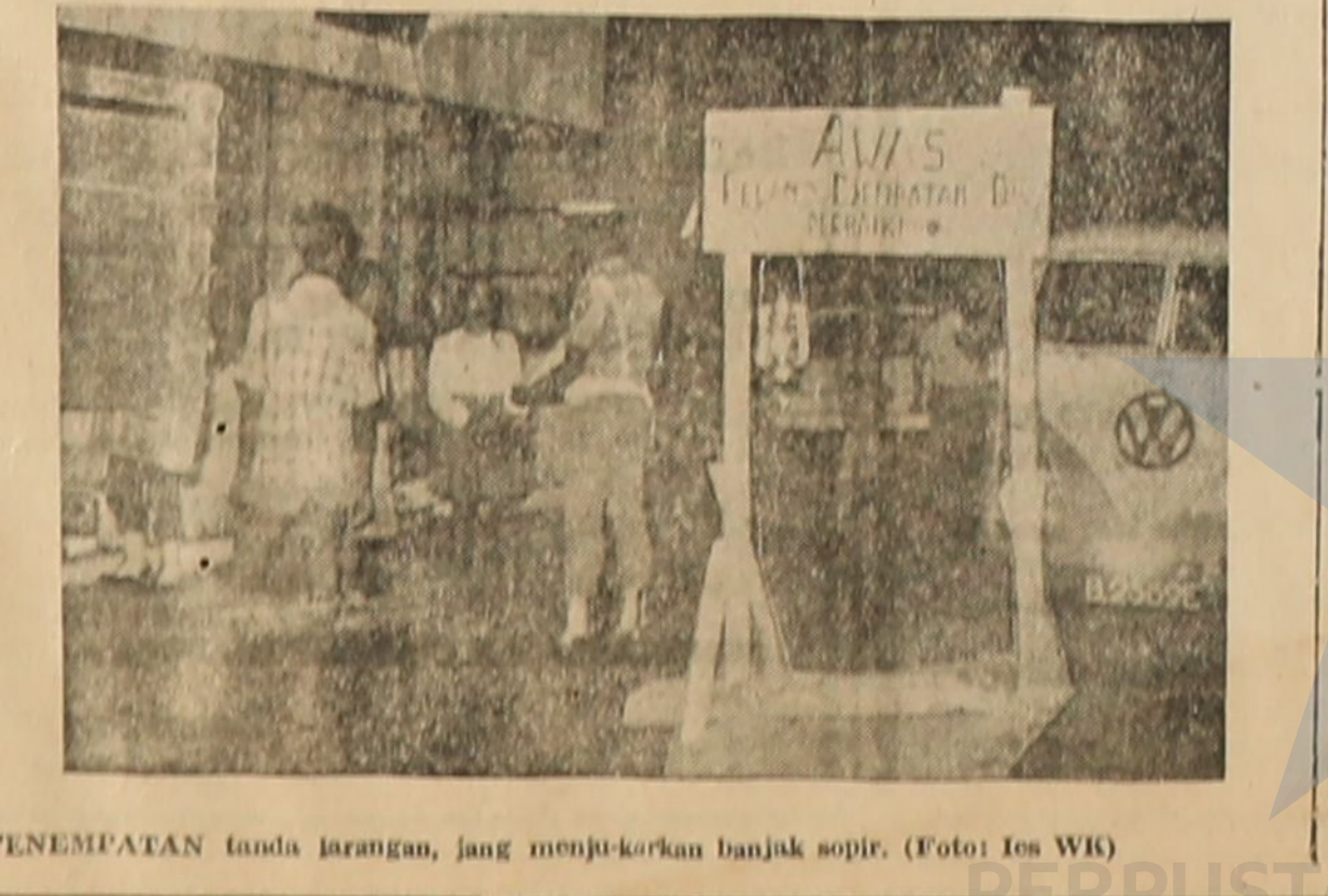
PENEMPATAN tanda larangan, yang menunjukkan banjak sopir.